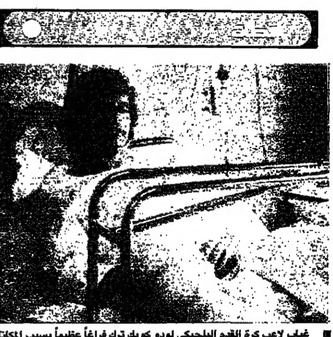
غياب لاعب كرة القدم البلجيكي لودو كويك ترك فراغاً عظيماً بسبب امكانته البارزة التي كان هذا اللاعب يحتفلها في الوسط الكروي البلجيكي. والصورة من لحز الشكرات للاعب كويك في المستشفى

يقدم نادي الاهلي صربيا، حفلة عشاء تكريمية بمناسبة فوز فريقه بدورة كأس الجبل، دعا اليها اعضاء اتحاد الكرة ولجنة نادي الروضة (الدوكة) والصحافة الرياضية وذلك في مطعم الأفا في الساعة الثامنة من مساء يوم الخميس الموافق ٢٦ كانون الأول ١٩٨٥. وقام عند الساعة الواحدة والنصف من بعد ظهر يوم الخميس ٢٦ الجاري حفلة تسليم كأس جبل لبنان الى فريق الاهلي صربيا، وكأس لآخر الى فريق نادي الروضة (الدوكة) الفائز الثاني وذلك في مقر اتحاد كرة القدم - بناية تاريخي شالوحي الطابق الأول، بحضور رجال الصحافة الرياضية واللجنة الادارية للحادث ولجنة منطقة جبل لبنان.